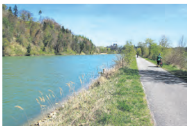
Radweg von Niederried Richtung Aarberg