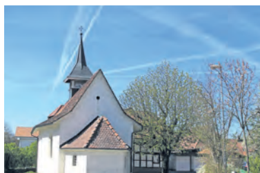
Kapelle von Wallenbuch

Das Wahrzeichen Laupens ist das aus dem 10. bis 13. Jahrhundert stammende Schloss. Wir verlassen das Städtchen in nordwestlicher Richtung. Bis Niederried (Kilometer 16) folgen wir konsequent der Radwanderroute 74 «Gürbe-Sense» (RWW 74). Das heisst, nach der Saanebrücke pedalieren wir links hinauf zur Hochebene von Kriechenwil und über Gammen und Wallenbuch nach Ritzenbach. Auf der Hauptstrasse fahren wir Richtung Neuenburg/Kerzers, um dann nach rund einem Kilometer rechts in den Wald einzubiegen. Unsere weiteren Stationen sind die ländlichen Siedlungen Haselhof, Wileroltigen, Golaten und Niederried. Von dort weg bis Aarberg folgen wir der Radwanderoute