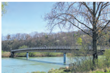
Velo- und Fussgängerbrücke Niederried